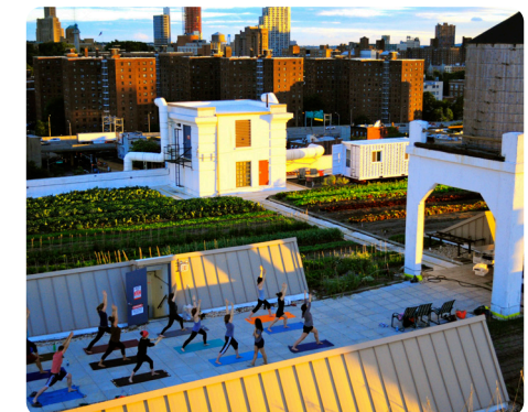
Impressie: Brooklyn Grange, New York, USA