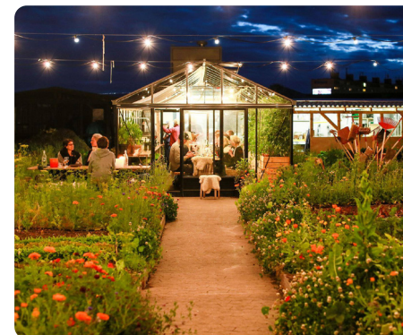
Impressie: Ostergro, Kopenhagen, Denemarken